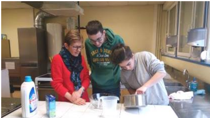
Atelier fabrication de produits d'entretien maison pour les ATM1 le 27 janvier 2020